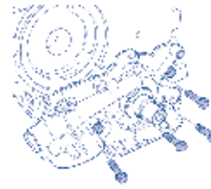
Instale o restante dos parafusos