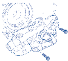
Coloque os parafusos das buchas

4. Coloque primeiro os parafusos onde estão as buchas guias e aperte-os com torque de 1,5 Nm. Gire o virabrequim com uma manivela: a bomba deve girar livremente, sem trancos, caso isso não ocorra, a causa deve ser investigada e sanada. Coloque os demais parafusos e aperte todos, de forma cruzada, com torque de 8 a 10 Nm. Em hipótese alguma termine a montagem se a bomba não girar livremente.