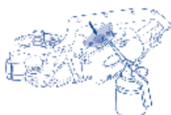
Carregue a bomba com óleo de motor