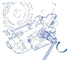
Gire novamente o virabrequim