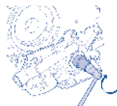
Gire o virabrequim para acomodar a bomba

4. Coloque primeiro os parafusos onde estão as buchas guias e aperte-os com torque de 1,5 Nm. Gire o virabrequim com uma manivela: a bomba deve girar livremente, sem trancos, caso isso não ocorra, a causa deve ser investigada e sanada. Coloque os demais parafusos e aperte todos, de forma cruzada, com torque de 8 a 10 Nm. Em hipótese alguma termine a montagem se a bomba não girar livremente.