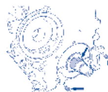
Inspeção das buchas e o encaixe no eixo

1. Verifique se as buchas guias da bomba de óleo estão no bloco do motor. Caso não estejam, utilize as buchas que acompanham a sua bomba de óleo. Verifique se a ponta do virabrequim onde encaixa a bomba está em boas condições.