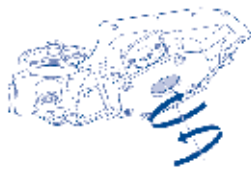
Gire as engrenagens internas

2. Carregue a bomba com óleo de motor através do furo do pescador e gire as engrenagens internas para lubrificação completa da bomba.