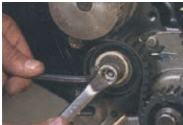
Figura 1, posicionamento correto do tensor